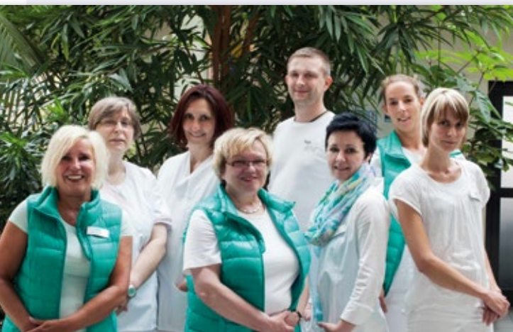
Unser kompetentes Pflegeteam sorgt für eine individuelle Betreuung rund um die Uhr.

Zudem unterstützen wir auch pflegende Angehörige und helfen ihnen bei der Kranken- und Seniorenbetreuung.